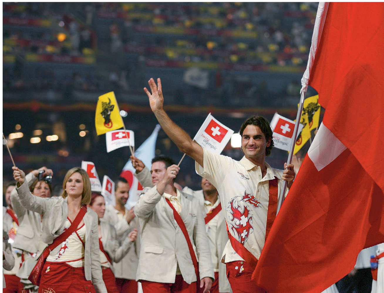
Roger Federer, Cérémonie d'ouverture Jeux Olympiques Pékin 2008