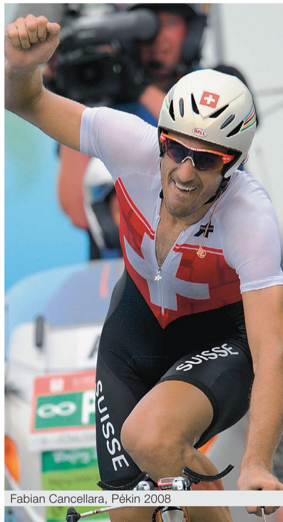
Fabian Cancellara, Pékin 2008