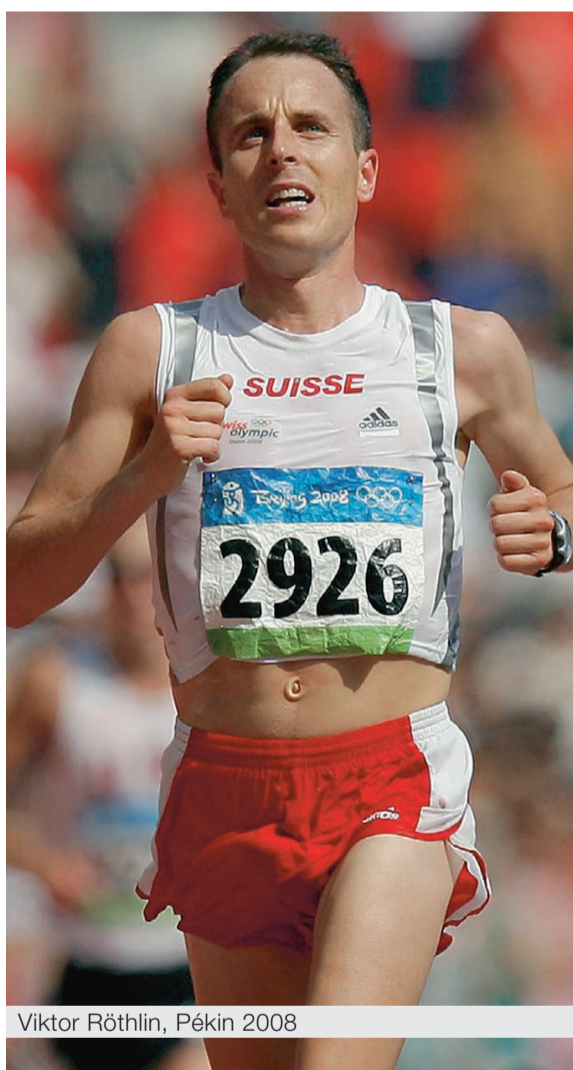
Viktor Röthlin, Pékin 2008